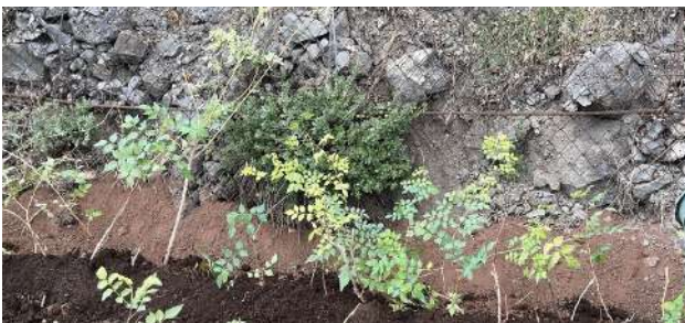
Նկ. 7. Տնկված բնափայտավոր լիաններ:

Նշված ժայռապատ լանդշաֆտի ստորին հատվածում քարե եզրագծի 0,5-1,0 մ լայնությամբ հետևամասում, մաքրվել են քարերն ու մոլախոտերը, անցկացվել է ոռոգման ջրագիծ, այնուհետև 40-50 սմ հաստությամբ շերտով լցվել է սննդանյութերով հարստացված հողախառնուրդ: Նախապատրաստական աշխատանքների ավարտից հետո, հաշվի առնելով կանաչապատվող տարածքի ռելիեֆը, կողմնադրությունը, ժայռապատերի բարձրությունը (2-27 մ), միկրոկլիման, «ԿՇՄՊ» ՀՈԱԿ-ի կողմից բազմացված բնափայտավոր լիանների տեսակները, դրանց աճման և զարգացման առանձնահատկությունները, ուղղաձիգ կանաչապատման համար ընտրվել ու տնկվել են փակ արմատային համակարգ ունեցող բնափայտավոր լիաններ՝ մշտադալար բաղեղ, արմատակալող կամպիս և հնգատերև խաղող (նկ. 7):