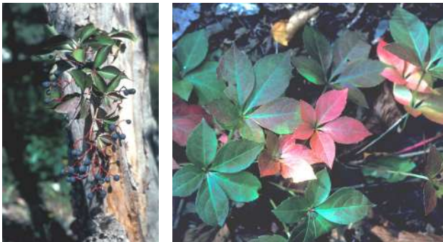
Նկ. 3. Կուսախաղող հնգատերև ( www.gobotany.nativeplanttrust.org ):

Կուսախաղող հնգատերև ( Parthenocissus quinquefolia (L.) Planch): Խաղողազգի լիան է, երկարությունը՝ 15-20 մ: Երիտասարդ ընձուղները թույլ կարմրավուն են, հենարանին ամրանում են բեղիկներով, տերևները թաթաձև են, 5-8 սմ երկարությամբ: Աշնանը գունափոխվում են և ստանում կարմրավուն երանգ: Ծաղիկները անշուք են, պտուղները՝ մուգ կապտավուն (նկ. 3): Հնգատերև կուսախաղողն արագաճ է, լավ է աճում ստվերում, բավական ցրտադիմացկուն է, նաև երաշտադիմացկուն, պահանջկոտ չէ հողի և խոնավության նկատմամբ, լավ է դիմակայում քաղաքային աղտոտվածությանը: