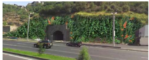
Նկ. 5. Մյասնիկյան պողոտայի սկզբնամասի ակնկալվող տեսքը (նախագիծը կազմվել է ըստ նկար 4-ի):