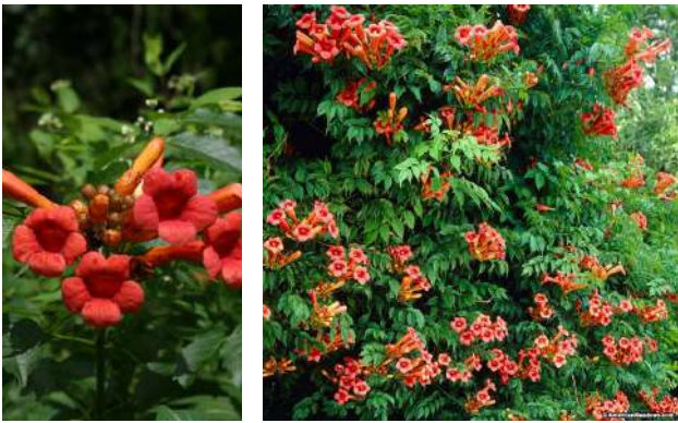
Նկ. 2. Կամպսիս արմատակալող ( www.csbe.org ):

Կամպսիս արմատակալող ( Campsis radicans (L.) Seem): Խլածաղկազգի, մինչև 15 մ երկարությամբ գեղազարդ լիան է, ցողունի վրա առկա բազմաթիվ օղային արմատների միջոցով ամրանում և բարձրանում է հենարանների վրա: Տերևները խոշոր են, մինչև 20 սմ երկարությամբ: Ծաղիկները կարմրանարնջավուն են, ձագարած, 8-9 սմ երկարությամբ (նկ. 2): Երևանում ծաղկում է հունիսին՝ շուրջ 3 ամիս: Հարկ է նշել, որ արմատակալող կամպսիսն արագաճ է, լավ է դիմանում երաշտին, չափավոր ցրտադիմացկուն է, հողի նկատմամբ քիչ պահանջկոտ: