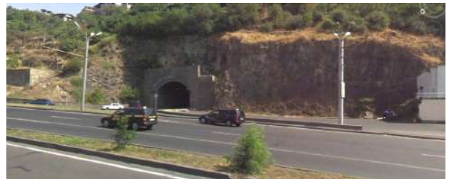
Նկ. 4. Մյասնիկյան պողոտայից Սարալանջ տանող թունելամերձ լանդշաֆտ ( www.google.com/maps ):

2022 թվականի աշնանը Երևանի Մյասնիկյան պողոտայի սկզբնամասում Սարալանջ տանող թունելի ձախակողմյան (30 գծ/մ) և աջակողմյան (40 գծ/մ) ցանցապատ հատվածներում «ԿՇՄՊ» ՀՈԱԿ-ի կողմից ըստ ֆիտոնախագծի իրականացվել են ուղղաձիգ կանաչապատման աշխատանքներ (նկ. 4-6):