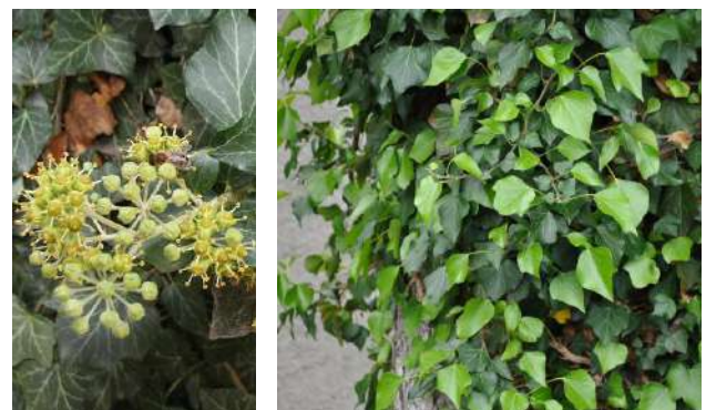
Սկ. 1. Բաղեղ սովորական:

Բաղեղ սովորական ( Hedera helix L.): Արալիազգի, մինչև 30 մ երկարությամբ մշտադալար լիան է, տերևները 4-10 սմ են, կաշենման, վերին մասում մուգ կանաչ, ստորին մասում՝ բաց կանաչավուն: Ծաղիկները մանր են, աստղաձև, բաց վարդադեղնավուն՝ հավաքված գնդանման հովանոցներում (սկ. 1): Երևանում ծաղկում է սեպտեմբերի երկրորդ կեսին՝ 25 օր տևողությամբ: Պտուղները կլոր են, սև գույնի: Բացի այդ՝ սովորական բաղեղը ջերմասեր է, սովորաբար, չի դիմանում սաստիկ ցրտին, հողի նկատմամբ պահանջկոտ է, լավ է դիմակայում ծիսին և թունավոր գազերին: Դրա բազմաթիվ պարտիզային հիբրիդներն աչքի են ընկնում տերևների բազմազանությամբ և խայտաբղետությամբ: